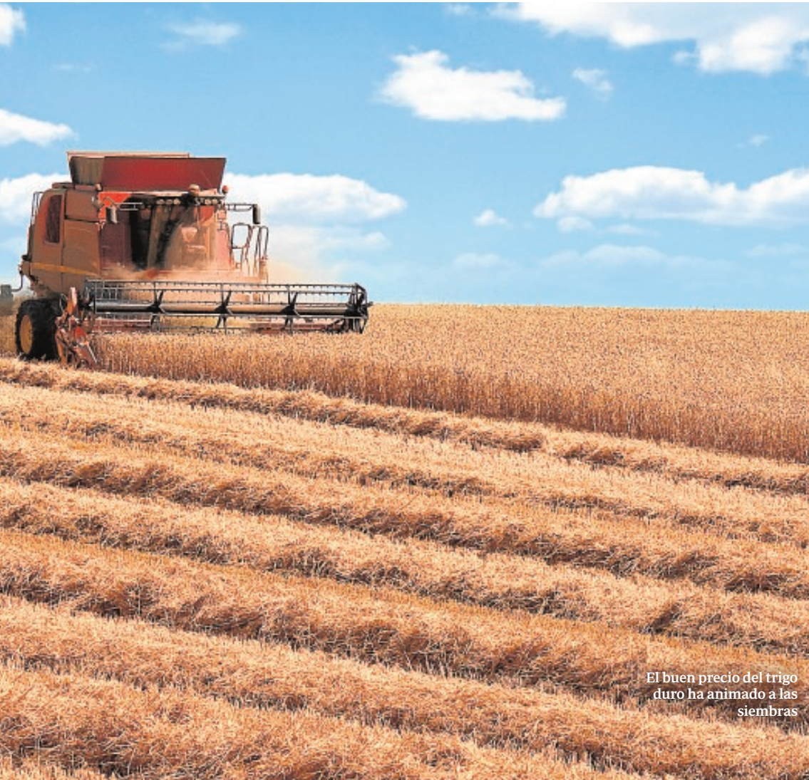
El buen precio del trigo duro ha animado a las siembras

paña de sementera es que «la superficie se mantenga, frenando la caída de los últimos años, debido sobre todo al auge del interés suscitado entre los productores por el girasol alto oleico», apunta Vázquez. De hecho, «si tradicionalmente se viene sembrando un 60% de girasol convencional y un 40% de alto oleico, se prevé que los porcentajes se inviertan, y el alto oleico cope al menos el 60% del cultivo».