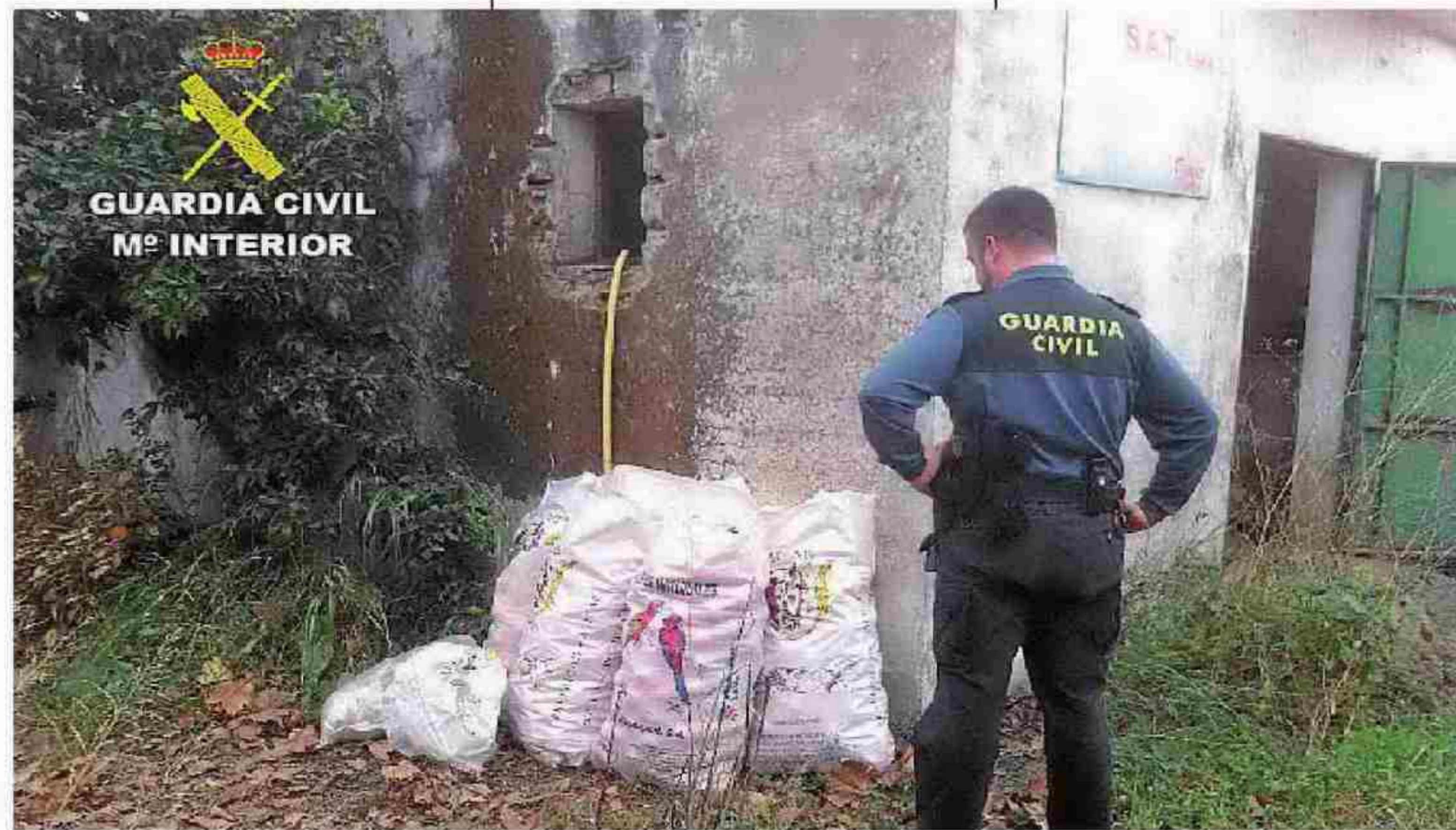
Un Guardia Civil ante varios sacos de naranjas robadas.