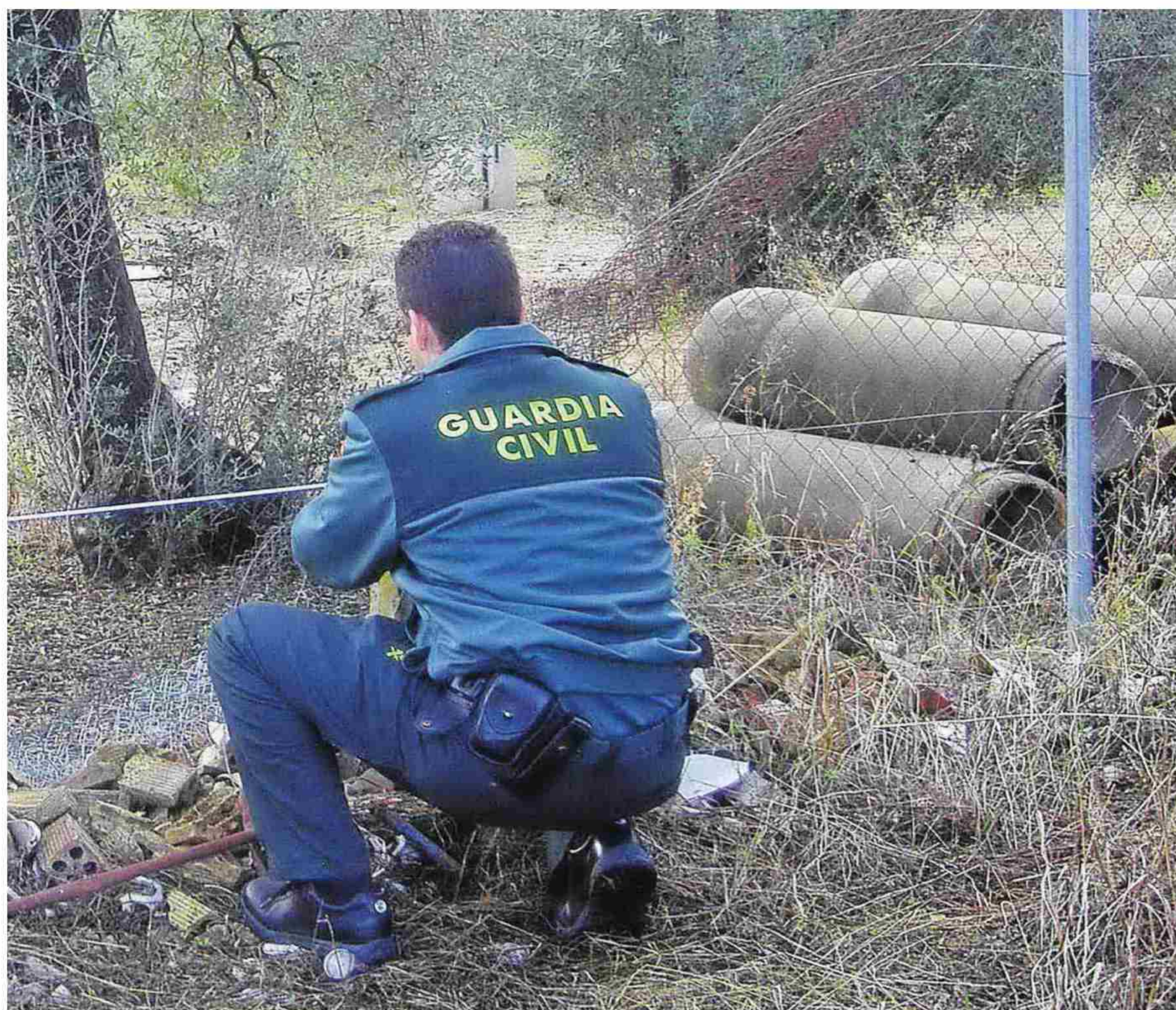
la provincia de Sevilla donde se ha producido un robo.

Balance del primer trimestre de 2015. Las sustracciones en explotaciones agrarias y ganaderas bajaron un 15,80 por ciento en Andalucía con respecto al mismo periodo del año pasado, según se desprende de las estadísticas periódicas sobre evolución de la delincuencia elaboradas por el Ministerio del Interior.