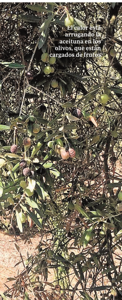
El calor está arrugando la aceituna en los olivos, que están cargados de frutos