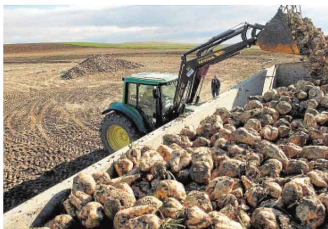
El anticipo incluye la ayuda asociada a la remolacha

Al margen del anticipo, Agricultura continuará trabajando para que los agricultores y ganaderos reciban los pagos correspondientes al saldo de las ayudas de la Política Agrícola Común de la campaña 2018 en el mes de diciembre.