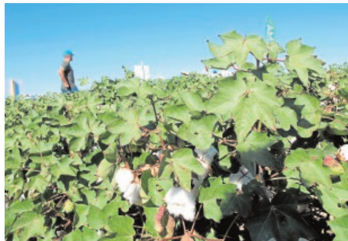
Las parcelas de secano tienen ya cápsulas abiertas

En cuanto al nivel de plagas como pulgones, heliotis y earias están siendo muy bajas en todas las provincias algoneras. En cambio, las capturas de adultos de gusano rosado han sido «algo elevadas» en la provincia de Cádiz.