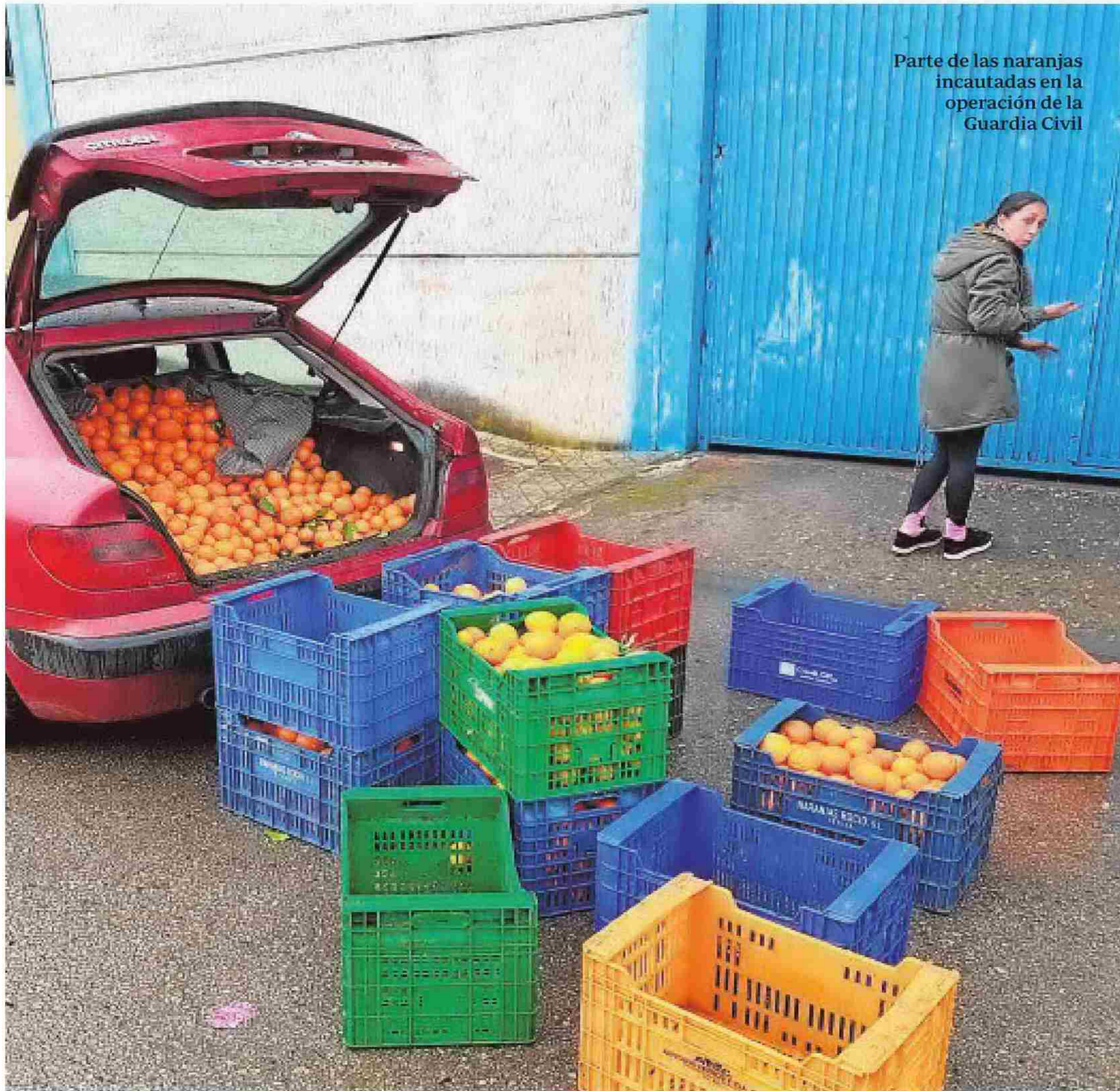
Parte de las naranjas incautadas en la operación de la Guardia Civil