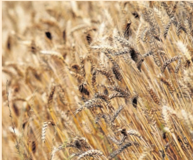
Sevilla es líder en producción de trigo duro

En el caso del trigo duro, el panorama es más optimista. Los agricultores podrán ver cómo se revalorizan sus cosechas en las próximas semanas, puesto que Italia, que ha tenido una mala cosecha, necesitará importar dos millones de toneladas de trigo duro y ni Grecia, ni el Norte de África, ni Canadá cuentan este año con excedentes, por lo que el trigo español «va a estar mucho más demandado».