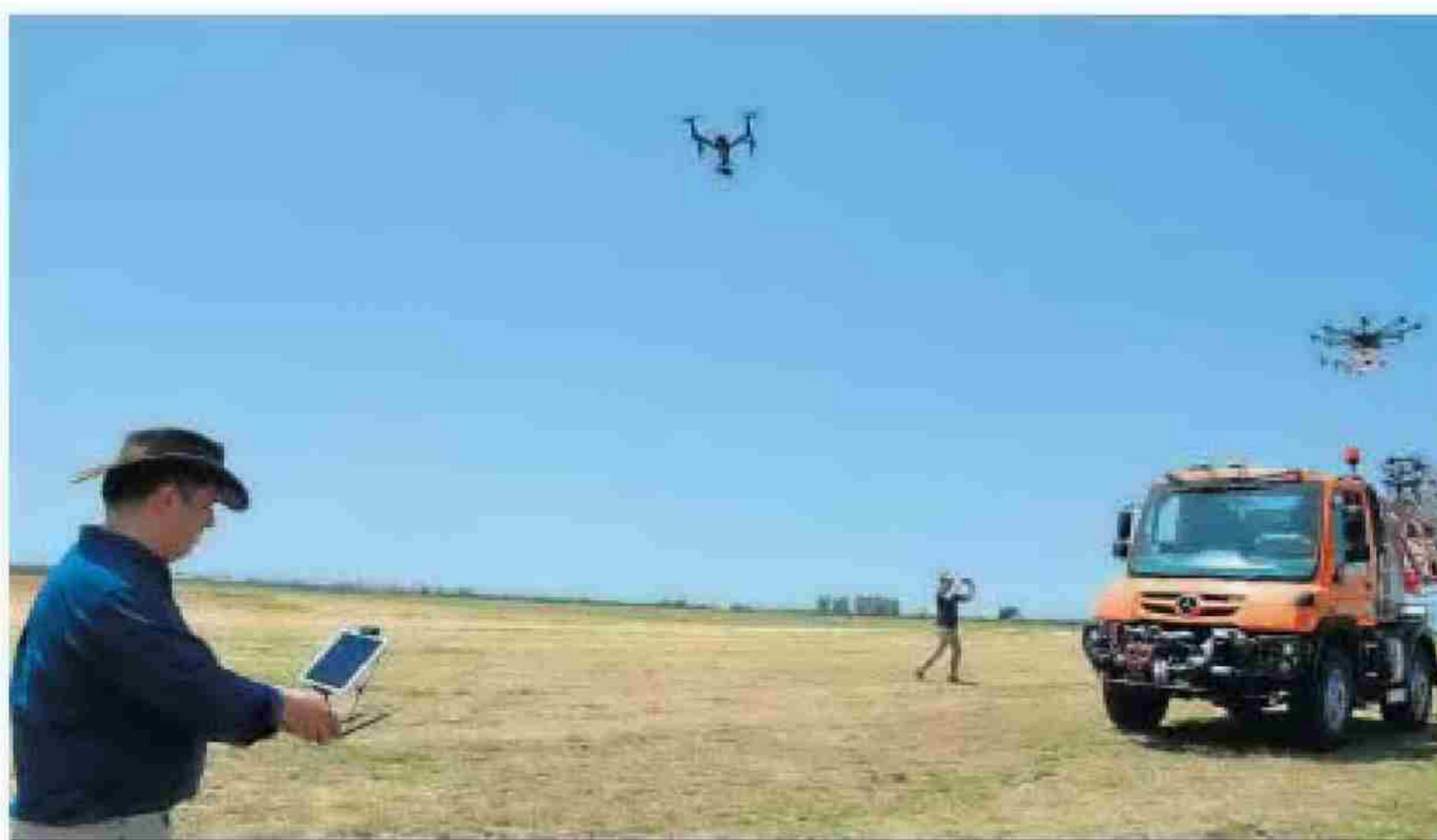
Demostración con drones en el 'Digital Farming Day' de Bayer, realizado en colaboración con Asaja-Sevilla.