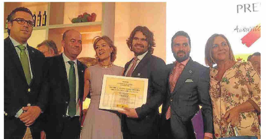
Entrega de los premios Alimentos de España con la ministra.

lleva a cabo acciones formativas en su centro de Hinojosa del Duque. Durante el último año ha crecido de manera exponencial la solicitud de cursos, se han registrado 162 visitas concertadas a este centro para recibir indicadores técnico-económicos y visitar la planta piloto e instalaciones donde se muestran los distintos sistemas de cría de caracol, en especial el pronto engorde .