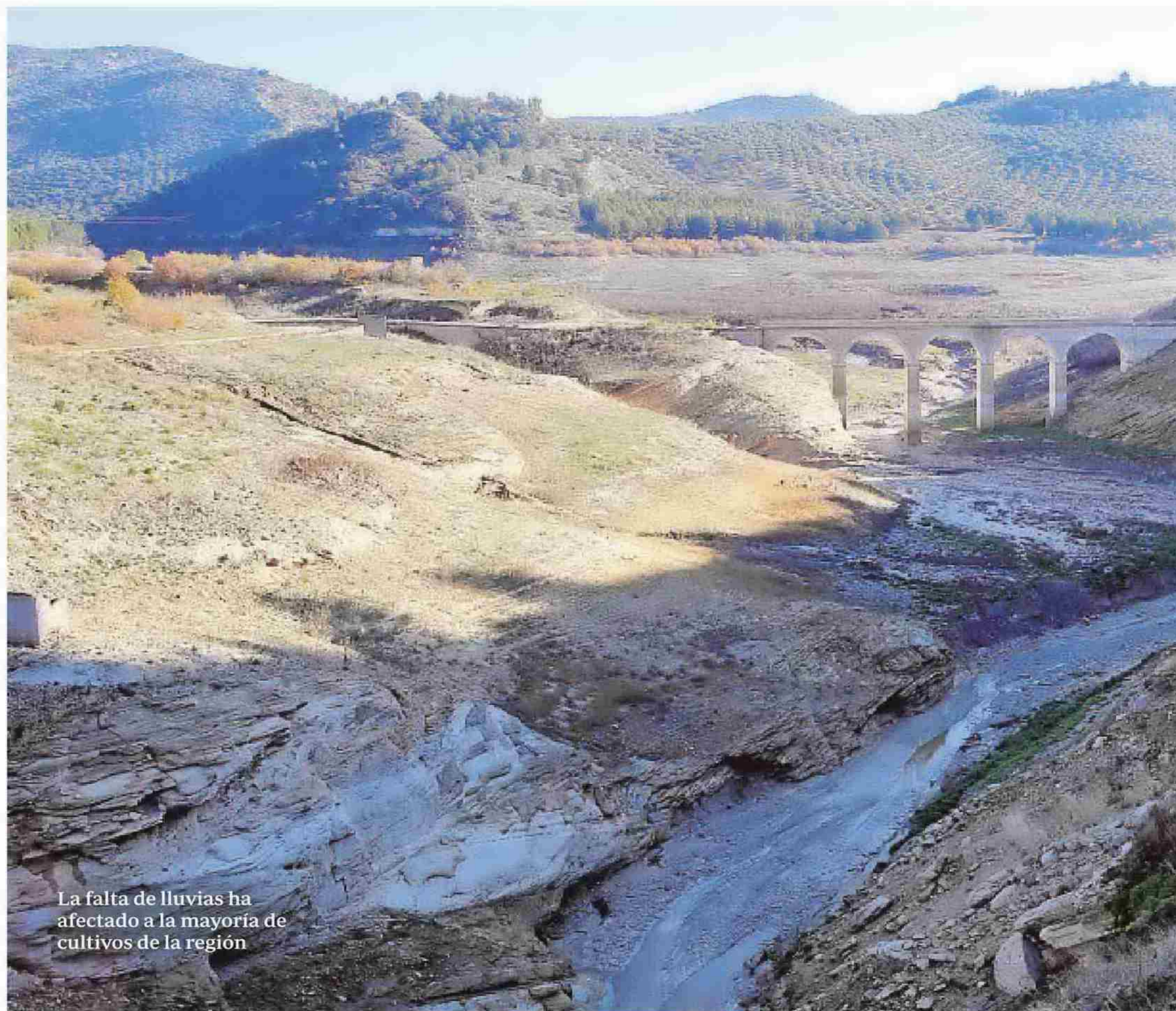
La falta de lluvias ha afectado a la mayoría de cultivos de la región

Uno de los cultivos más afectados y con peor pronóstico de la campaña de 2017 es la patata, ya que ha sufrido un hundimiento de precios y